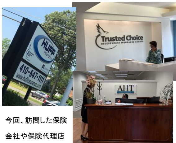
今回、訪問した保険会社や保険代理店

研修では、アメリカの保険会社や、保険代理店で、そのスタッフから様々な話を聞き、日本の保険業界との違いを学ぶことができたそうです。(以下、研修の内容抜粋)